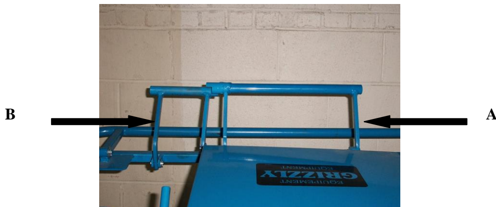
Fig. 3 : Contrôles du Workhorse A- Poignée d'embrayage B- Poignée de frein

Pour avancer, tirer la poignée d'embrayage (A). Le frein relâche automatiquement dès que l'embrayage est engagé. Pour arrêter, relâcher la poignée d'embrayage pour débrayer et activer le frein. La vitesse est contrôlée par le réglage de l'accélérateur et le degré d'engagement de l'embrayage. Pour une durée de vie maximale de la courroie, l'embrayage doit être engagé complètement durant l'opération. Tirer sur la poignée de frein (B) permettra à l'opérateur de tirer ou de pousser le Workhorse sans engager le moteur. Relâcher la poignée de frein (B) engagera automatiquement le frein. Le Workhorse est muni d'un frein d'arrêt d'urgence à enclenchement automatique. S'il y a urgence ou lorsqu'on veut freiner rapidement, il suffit de relâcher les leviers et le Workhorse s'arrêtera automatiquement.