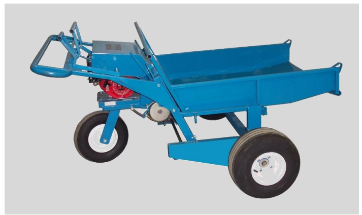
Fig. 6 Benne à déchets 330 700