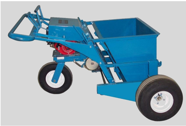
Fig. 5 Épandeur à gravier 330 500