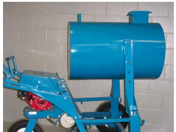
Fig. 7 Réservoir 330 100

Installer les supports de réservoir dans les montants à l'avant du Workhorse. Mettre le réservoir en place et insérer les deux barres de supports à travers les supports et le réservoir.