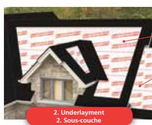
2. Underlayment 2. Sous-couche

Fournissent une deuxième ligne de défense contre les infiltrations d'eau causées par les digues de glace ou les pluies violentes qui risquent de provoquer de coûteux dommages.