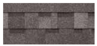
Charcoal Grey · Gris charbon