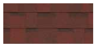
Riviera Red · Rouge riviera