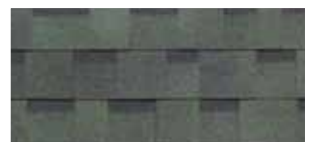
Vintage Green · Vert antique