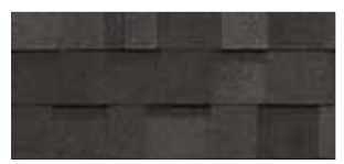
Dual Black · Noir double