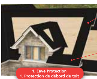
1. Eave Protection 1. Protection de débord de toit

le système « Pro 4 » de IKO établit le standard de protection du toit de votre maison. IKO se sert de la technologie la plus avancée pour concevoir ses bardeaux Crowne Slate, Armourshake, Royal Estate, Grandeur*, Cambridge et Marathon; les consommateurs qui exigent la meilleure qualité, durabilité et valeur les choisissent. Couplé aux bardeaux de qualité de IKO, le système « Pro 4 » comprend ces produits complémentaires.