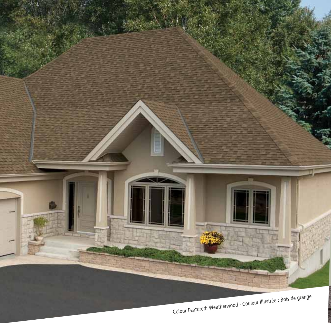
Colour Featured: Weatherwood · Couleur illustrée : Bois de grange