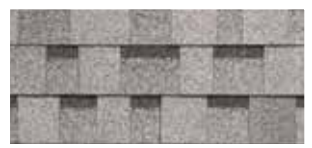
Dual Grey · Gris double