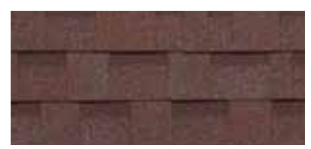
Aged Redwood · Séquoia vieilli