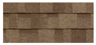
Weatherwood · Bois de grange