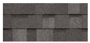
Harvard Slate · Ardoise « Harvard »