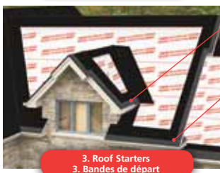
3. Roof Starters 3. Bandes de départ

Pour une protection totale du support de toit.