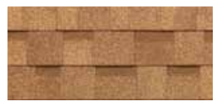
Earthtone Cedar · Cèdre « Earthtone »