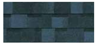
National Blue** · Bleu national**