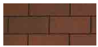
Riviera Red · Rouge riviera