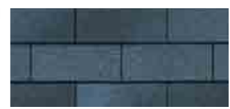
National Blue** · Bleu national**