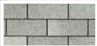
Dual Grey · Gris double