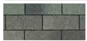
Harvard Slate · Ardoise « Harvard »