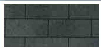
Dual Black · Noir double