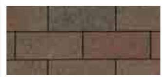
Aged Redwood · Séquoia vieilli