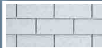
Super White · Super Blanc