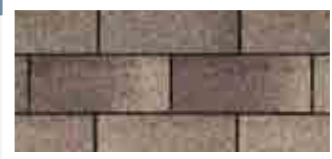
Weatherwood · Bois de grange