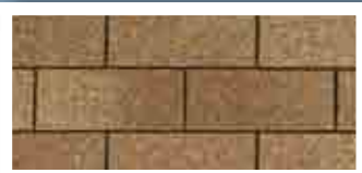
Earthtone Cedar · Cèdre « Earthtone »