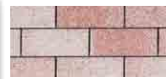
Rainbow Red · Rouge arc-en-ciel