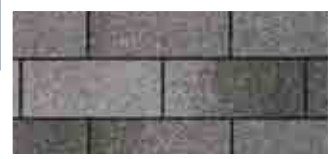
Charcoal Grey · Gris charbon