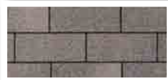
Driftwood · Bois flottant