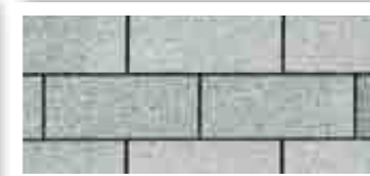
Rainbow Green · Vert arc-en-ciel