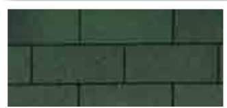
Vintage Green · Vert antique